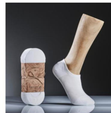
Ankelstrumpor, vita 7 par, 200 kr One size (strl 36-44), Unisex Högsta kvalitet bambusviskos