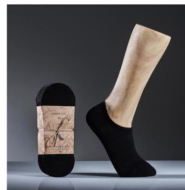
Ankelstrumpor, svarta 7 par, 200 kr One size (strl 36-44), Unisex Högsta kvalitet bambusviskos

Vill du stödja oss och samtidigt få Sveriges skönaste strumpor?