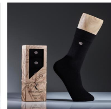
Klassiska strumpor, svarta 5 par, 200 kr One size (38-45), Unisex Högsta kvalitet bambusviskos